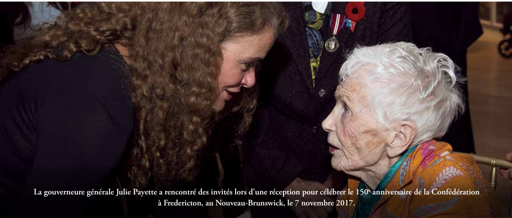
La gouverneure générale Julie Payette a rencontré des invités lors d'une réception pour célébrer le 150 e anniversaire de la Confédération à Fredericton, au Nouveau-Brunswick, le 7 novembre 2017.

La planification et la collaboration sont essentielles pour assurer le succès d'une visite officielle menée par un gouverneur général dans une province. Il faut des mois de préparation et de travail d'équipe pour qu'une visite, dans toute sa complexité, se déroule sans faille. Cela a été un plaisir de travailler avec l'équipe de la gouverneure générale à la planification de sa première visite officielle au Nouveau-Brunswick.