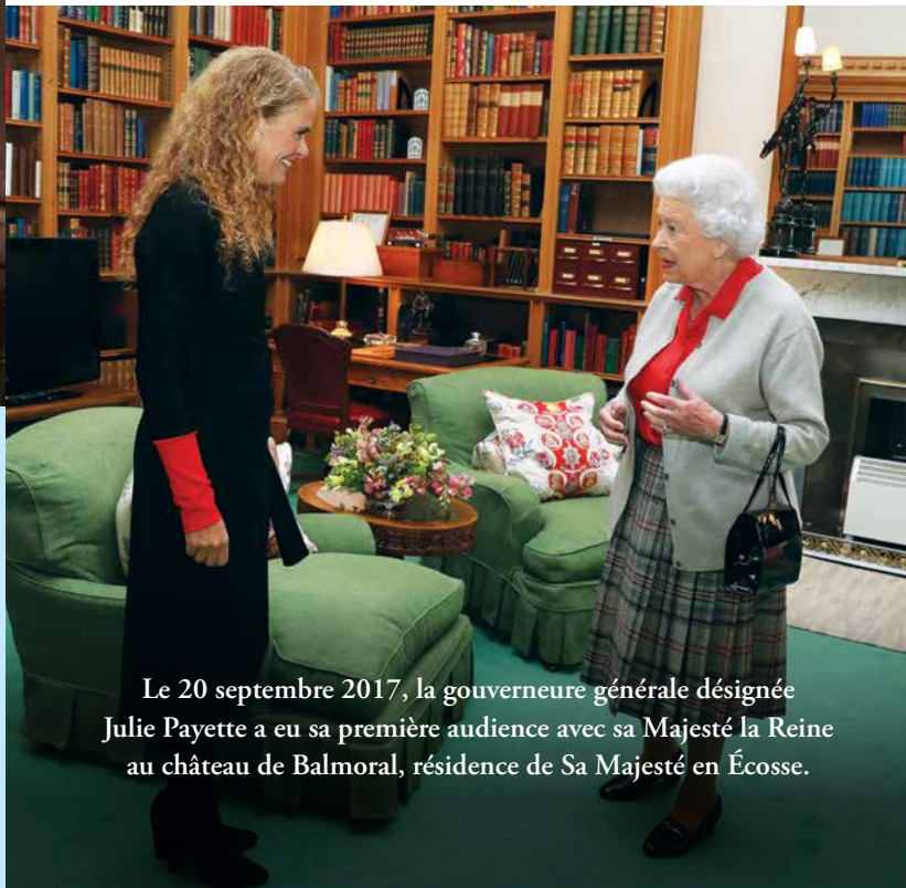
Le 20 septembre 2017, la gouverneure générale désignée Julie Payette a eu sa première audience avec sa Majesté la Reine au château de Balmoral, résidence de Sa Majesté en Écosse.