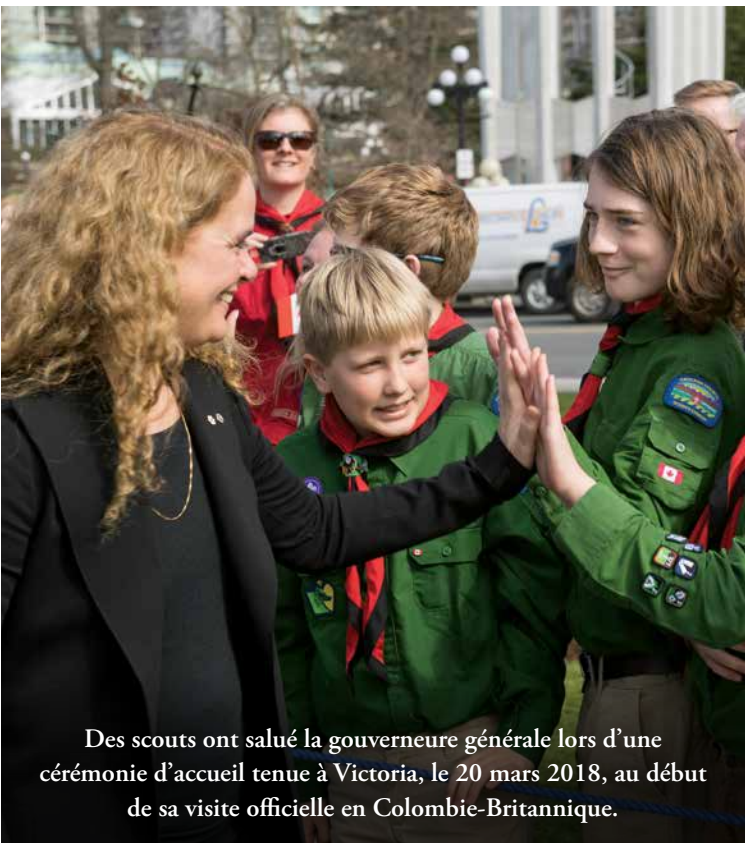
Des scouts ont salué la gouverneure générale lors d'une cérémonie d'accueil tenue à Victoria, le 20 mars 2018, au début de sa visite officielle en Colombie-Britannique.