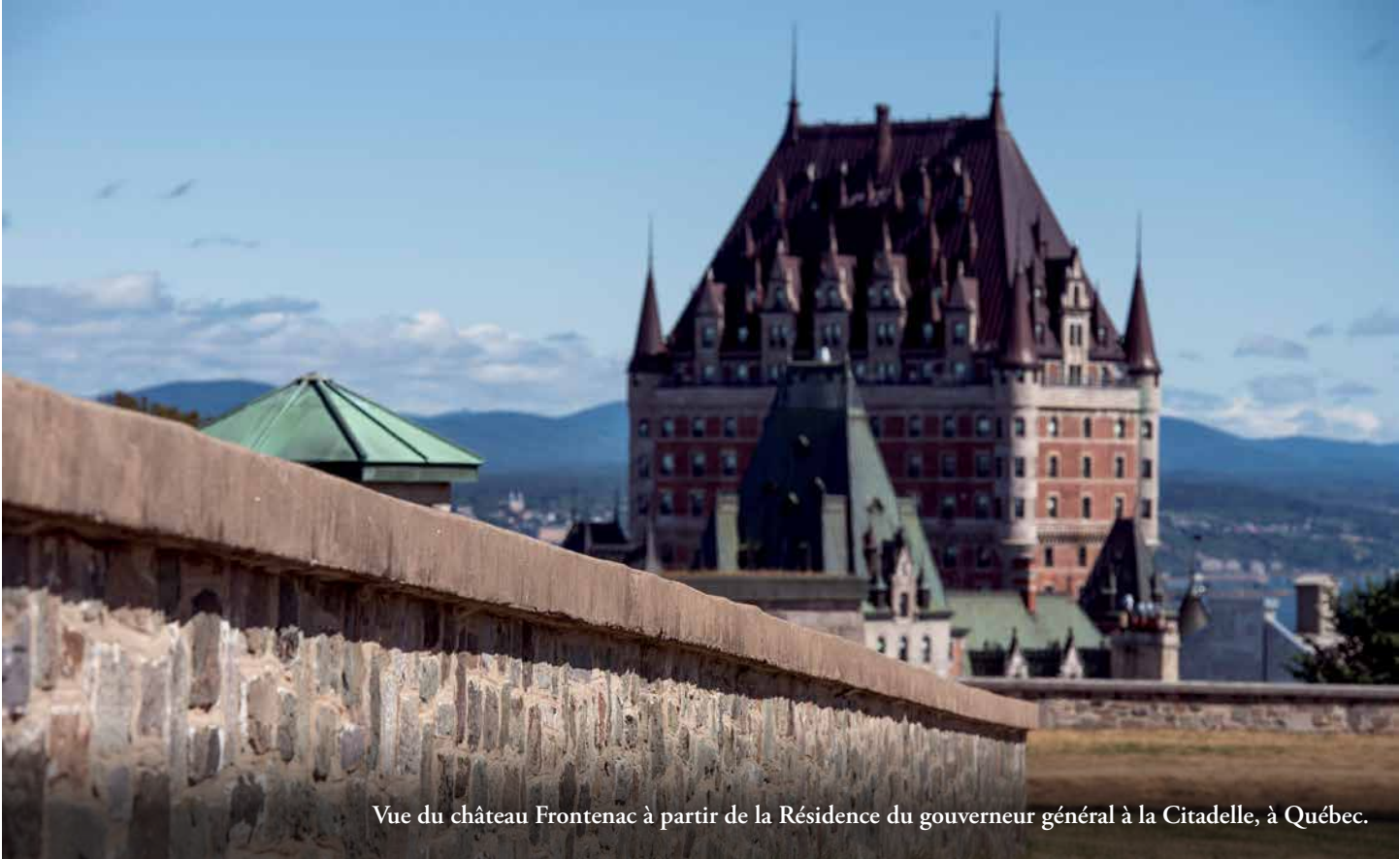
Vue du château Frontenac à partir de la Résidence du gouverneur général à la Citadelle, à Québec.