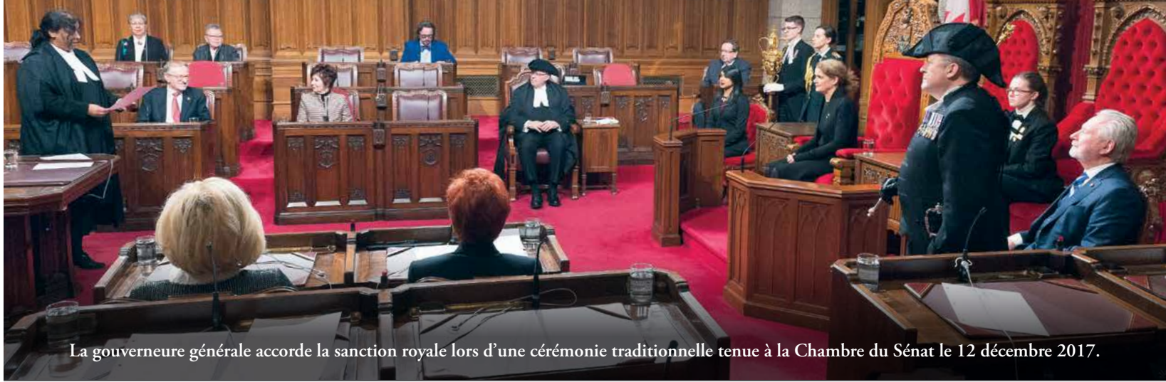
La gouverneure générale accorde la sanction royale lors d'une cérémonie traditionnelle tenue à la Chambre du Sénat le 12 décembre 2017.