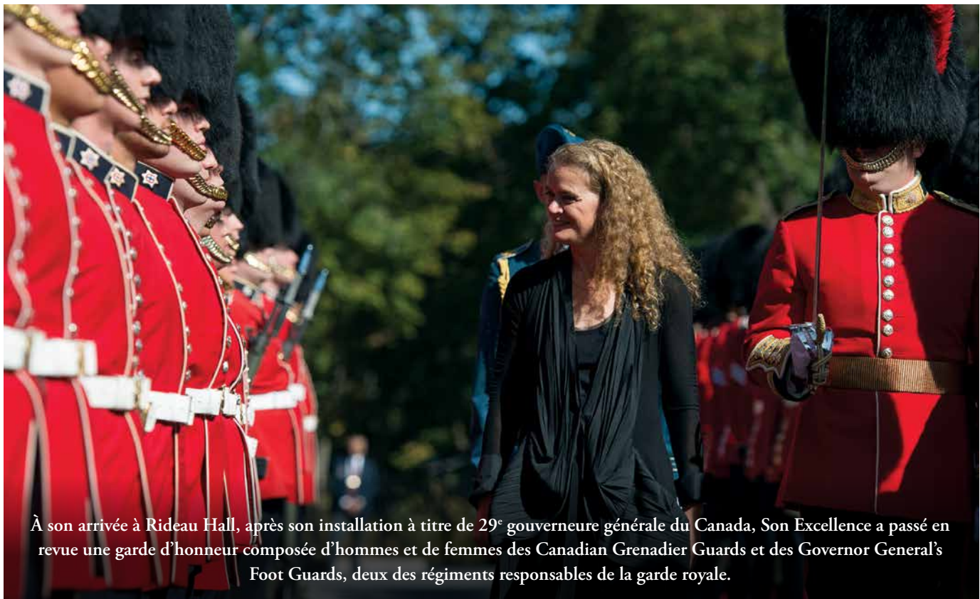
À son arrivée à Rideau Hall, après son installation à titre de 29 e gouverneure générale du Canada, Son Excellence a passé en revue une garde d'honneur composée d'hommes et de femmes des Canadian Grenadier Guards et des Governor General's Foot Guards, deux des régiments responsables de la garde royale.

Je suis convaincue que rien ne nous est impossible et que nous pouvons relever tous les défis si nous sommes disposés à travailler avec les autres, à aller au-delà de nos visées personnelles, à envisager les intérêts supérieurs, et à faire le nécessaire pour assurer le bien commun.