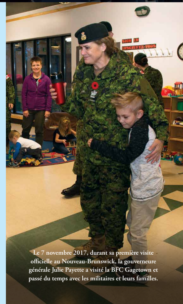
Le 7 novembre 2017, durant sa première visite officielle au Nouveau-Brunswick, la gouverneure générale Julie Payette a visité la BFC Gagetown et passé du temps avec les militaires et leurs familles.