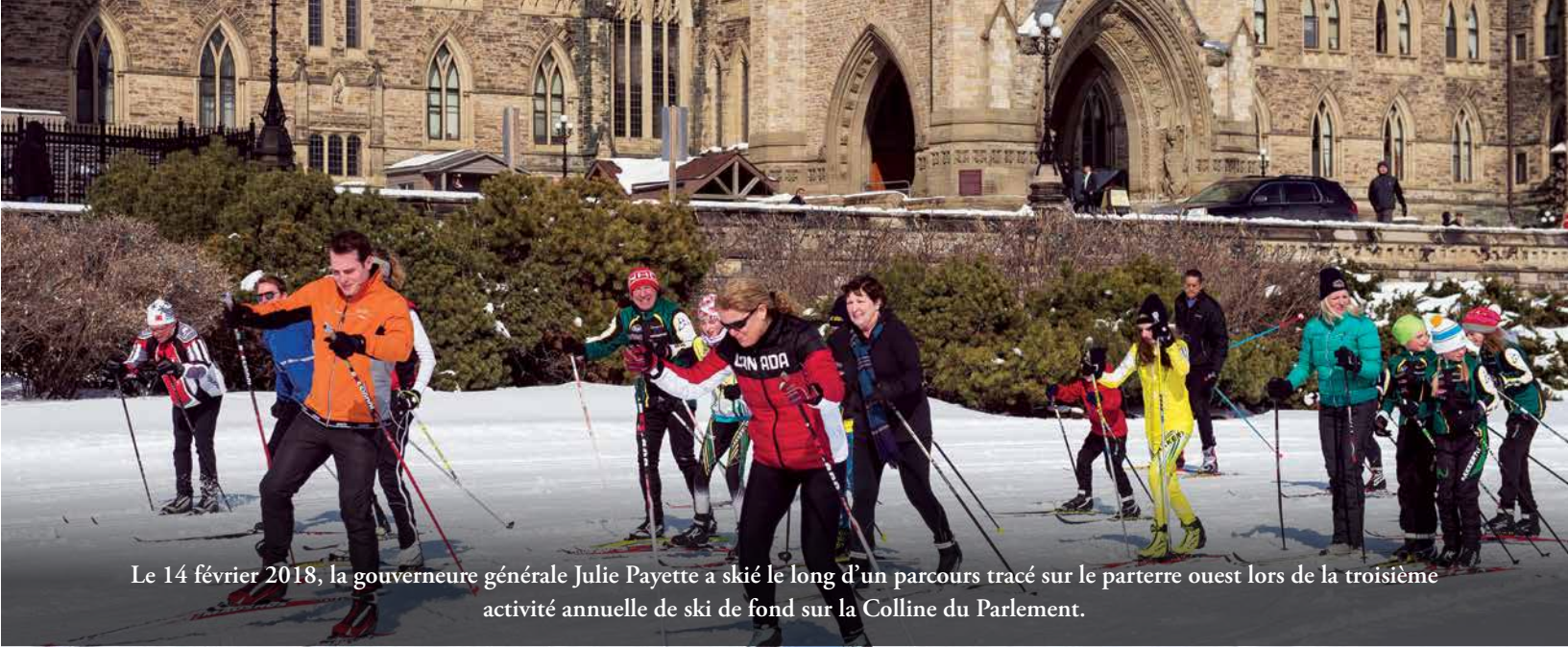
Le 14 février 2018, la gouverneure générale Julie Payette a skié le long d'un parcours tracé sur le parterre ouest lors de la troisième activité annuelle de ski de fond sur la Colline du Parlement.