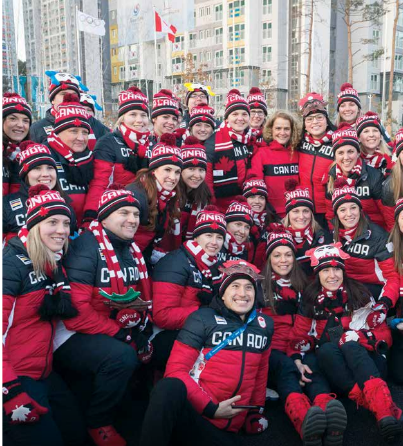
À PyeongChang pour l'ouverture des Jeux olympiques d'hiver, la gouverneure générale Julie Payette a visité le Village des athlètes et rencontré des athlètes canadiens.

« Ce fut un grand honneur de rencontrer M me Payette à l'occasion des Jeux olympiques de PyeongChang. J'ai une admiration sans bornes pour les astronautes parce qu'ils doivent aussi s'astreindre à un entraînement rigoureux pour réaliser leurs rêves. Je ne sais pas ce que l'on ressent en apesanteur dans l'espace, mais j' imagine que c'est un peu la même charge d'adrénaline que celle que j'ai ressentie en remportant ma médaille d'or aux Jeux! »