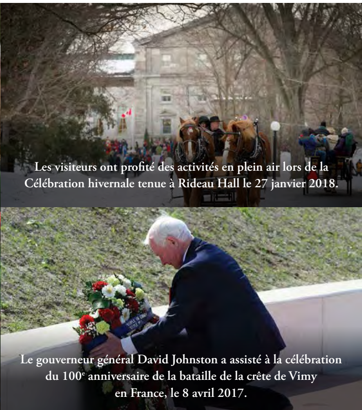
Les visiteurs ont profité des activités en plein air lors de la Célébration hivernale tenue à Rideau Hall le 27 janvier 2018.