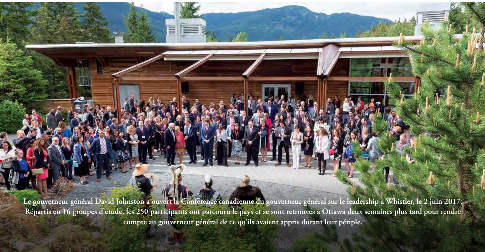
Le gouverneur général David Johnston a ouvert la Conférence canadienne du gouverneur général sur le leadership à Whistler, le 2 juin 2017. Répartis en 16 groupes d'étude, les 250 participants ont parcouru le pays et se sont retrouvés à Ottawa deux semaines plus tard pour rendre compte au gouverneur général de ce qu'ils avaient appris durant leur périple.