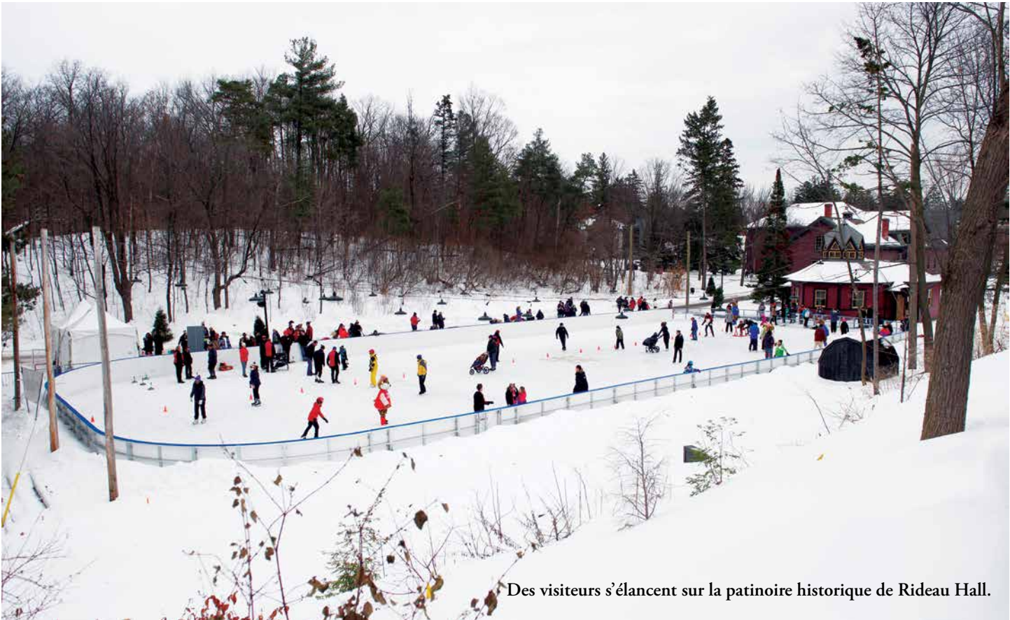
Des visiteurs s'élancent sur la patinoire historique de Rideau Hall.