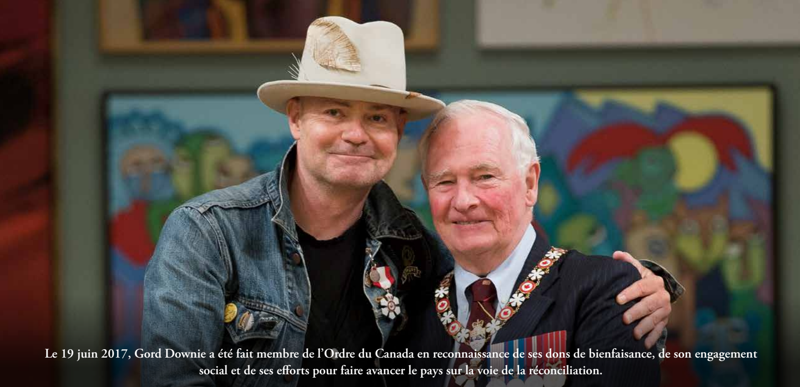
Le 19 juin 2017, Gord Downie a été fait membre de l'Ordre du Canada en reconnaissance de ses dons de bienfaisance, de son engagement social et de ses efforts pour faire avancer le pays sur la voie de la réconciliation.

L'Ordre du Canada regroupe un réseau extraordinaire de gens talentueux, bienveillants et dynamiques provenant des quatre coins de ce pays immense et diversifié, mais comme c'est le cas dans tout groupement d'individus, l'Ordre est bien plus que la somme de ses parties.