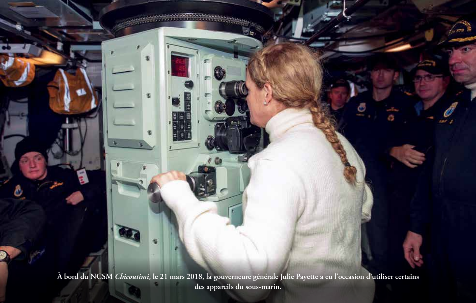
À bord du NCSM Chicoutimi , le 21 mars 2018, la gouverneure générale Julie Payette a eu l'occasion d'utiliser certains des appareils du sous-marin.

Ce fut un honneur d'accueillir la commandante en chef à bord du sous-marin canadien de Sa Majesté Chicoutimi à notre retour de l'Asie-Pacifique en 2018. Quelle expérience unique que de présenter l'équipage et de faire la démonstration des systèmes qui nous permettent de vivre sous l'eau à une personne qui a séjourné dans l'espace. J'espère pouvoir accueillir la commandante en chef à bord du NCSM Victoria en 2019 et la laisser descendre le sous-marin.