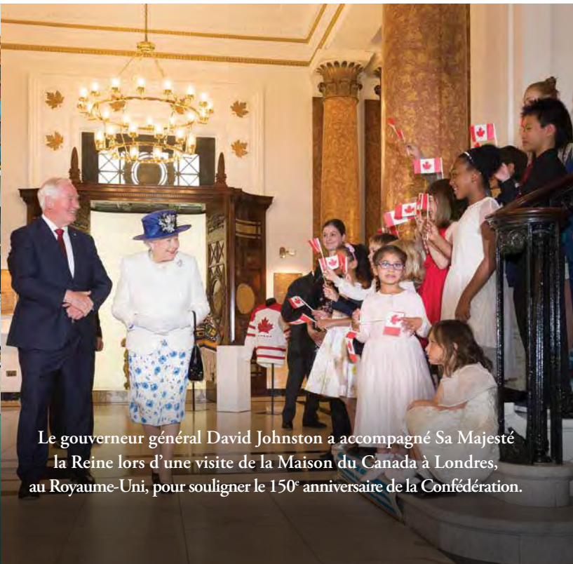
Le gouverneur général David Johnston a accompagné Sa Majesté la Reine lors d'une visite de la Maison du Canada à Londres, au Royaume-Uni, pour souligner le 150 e anniversaire de la Confédération.