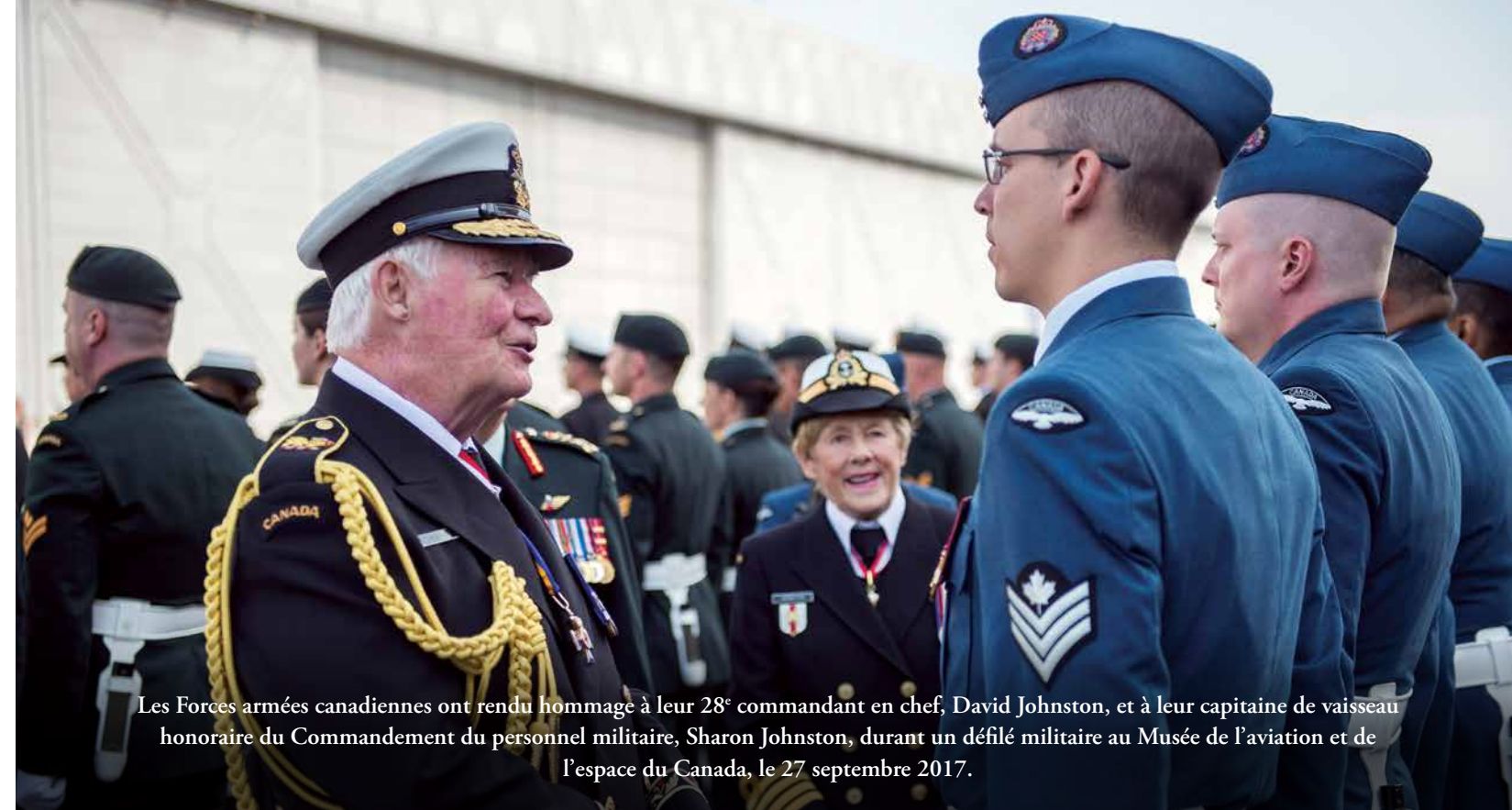
Les Forces armées canadiennes ont rendu hommage à leur 28 e commandant en chef, David Johnston, et à leur capitaine de vaisseau honoraire du Commandement du personnel militaire, Sharon Johnston, durant un défilé militaire au Musée de l'aviation et de l'espace du Canada, le 27 septembre 2017.

Tout au long de l'année, les gouverneurs généraux David Johnston et Julie Payette ont reconnu les efforts soutenus de membres des Forces armées canadiennes en leur remettant des insignes de l'Ordre du mérite militaire. De plus, des décorations pour service méritoire (division militaire) ont été remises pour souligner les réalisations particulières qui ont fait honneur aux Forces armées canadiennes et au Canada.