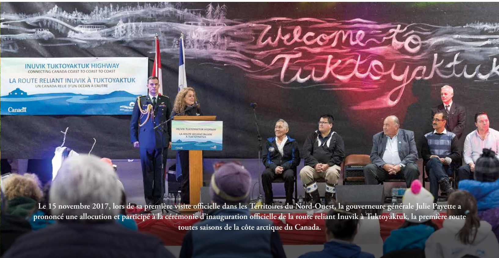
Le 15 novembre 2017, lors de sa première visite officielle dans les Territoires du Nord-Ouest, la gouverneure générale Julie Payette a prononcé une allocution et participé à la cérémonie d'inauguration officielle de la route reliant Inuvik à Tuktoyaktuk, la première route toutes saisons de la côte arctique du Canada.