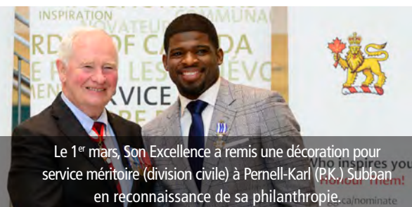
Le 1 er mars, Son Excellence a remis une décoration pour service méritoire (division civile) à Purnell-Karl (P.K.) Subban en reconnaissance de sa philanthropie.

Le Bureau, par l'intermédiaire de la Chancellerie des distinctions honorifiques, administre tous les volets du Régime canadien de distinctions honorifiques ainsi que la remise de la Médaille académique du Gouverneur général.