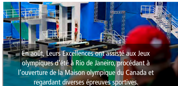
En août, Leurs Excellences ont assisté aux Jeux olympiques d'été à Rio de Janeiro, procédant à l'ouverture de la Maison olympique du Canada et regardant diverses épreuves sportives.