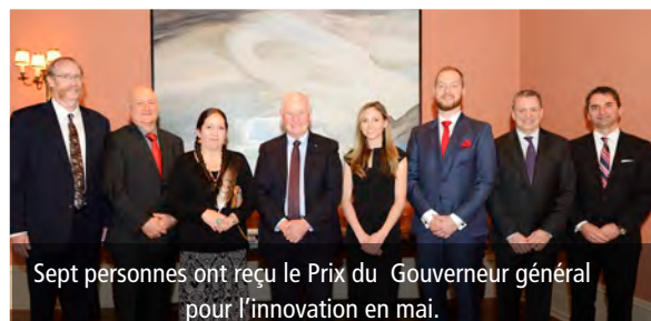
Sept personnes ont reçu le Prix du Gouverneur général pour l'innovation en mai.