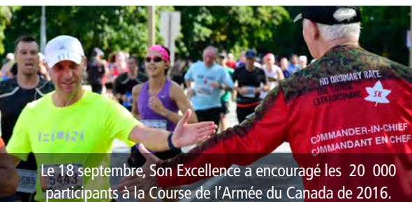
Le 18 septembre, Son Excellence a encouragé les 20 000 participants à la Course de l'Armée du Canada de 2016.