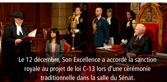
Le 12 décembre, Son Excellence a accordé la sanction royale au projet de loi C-13 lors d'une cérémonie traditionnelle dans la salle du Sénat.

En 2016-2017, le Bureau a appuyé plus de 95 activités visant à représenter la Couronne au Canada.