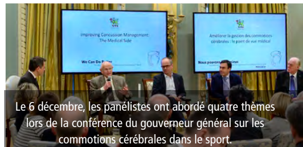
Le 6 décembre, les panélistes ont abordé quatre thèmes lors de la conférence du gouverneur général sur les commotions cérébrales dans le sport.