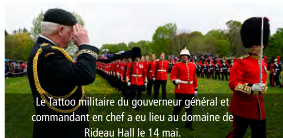
Le Tattoo militaire du gouverneur général et commandant en chef a eu lieu au domaine de Rideau Hall le 14 mai.