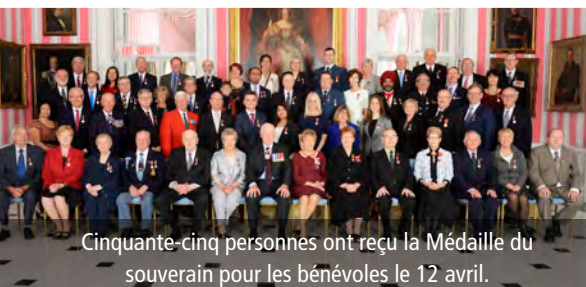
Cinquante-cinq personnes ont reçu la Médaille du souverain pour les bénévoles le 12 avril.

Le gouverneur général décerne des distinctions honorifiques et des prix à des gens qui ont fait preuve d'excellence ou d'une volonté de servir le pays. L'excellence et les réalisations sont soulignées par le biais du Régime canadien de distinctions honorifiques et par la concession d'emblèmes héraldiques (armoiries, drapeaux et insignes).