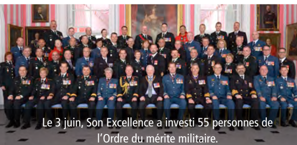
Le 3 juin, Son Excellence a investi 55 personnes de l'Ordre du mérite militaire.