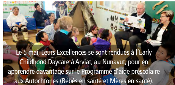
Le 5 mai, Leurs Excellences se sont rendues à l'Early Childhood Daycare à Arviat, au Nunavut, pour en apprendre davantage sur le Programme d'aide préscolaire aux Autochtones (Bébé en santé et Mère en santé).