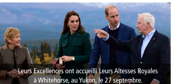
Leurs Excellences ont accueilli Leurs Altesses Royales à Whitehorse, au Yukon, le 27 septembre.