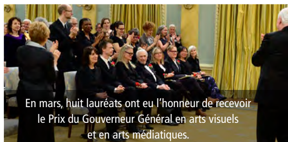
En mars, huit lauréats ont eu l'honneur de recevoir le Prix du Gouverneur Général en arts visuels et en arts médiatiques.