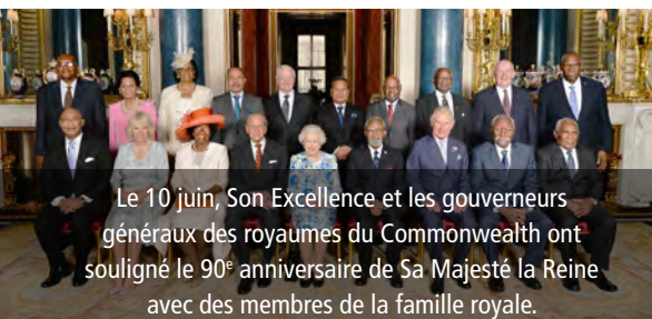
Le 10 juin, Son Excellence et les gouverneurs généraux des royaumes du Commonwealth ont souligné le 90 e anniversaire de Sa Majesté la Reine avec des membres de la famille royale.

L'une des responsabilités du gouverneur général est de veiller à ce que le Canada ait toujours un premier ministre. Le gouverneur général préside l'assermentation du premier ministre, du juge en chef du Canada et des ministres du Cabinet; convoque, proroge et dissout le Parlement; prononce le discours du Trône; et accorde la sanction royale aux mesures législatives parlementaires. Le gouverneur général agit selon l'avis du premier ministre, mais a le droit de donner des conseils, de formuler des encouragements et de faire des mises en garde.