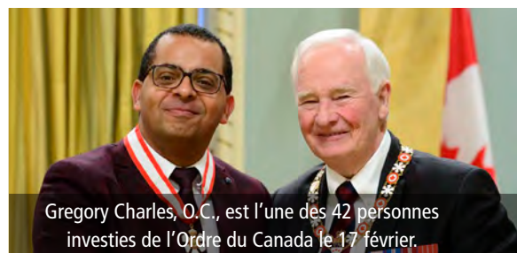
Gregory Charles, O.C., est l'une des 42 personnes investies de l'Ordre du Canada le 17 février.