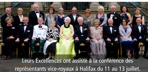
Leurs Excellences ont assisté à la conférence des représentants vice-royaux à Halifax du 11 au 13 juillet.