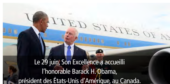
Le 29 juin, Son Excellence a accueilli l'honorable Barack H. Obama, président des États-Unis d'Amérique, au Canada.