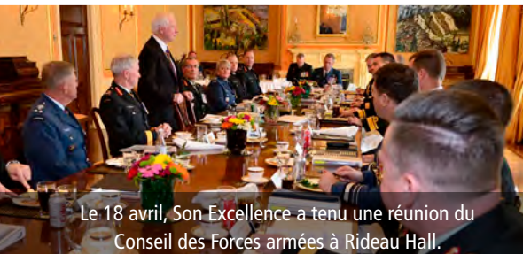
Le 18 avril, Son Excellence a tenu une réunion du Conseil des Forces armées à Rideau Hall.

Le gouverneur général rend visite aux membres des Forces armées canadiennes (FAC), à leurs familles et à leurs proches, au pays et à l'étranger, décerne des distinctions militaires et présente de nouveaux drapeaux aux FAC. Il signe tous les certificats de commission des officiers qui servent dans les Forces, ainsi que ceux des nouveaux généraux et officiers généraux. De plus, sur la recommandation du premier ministre, il nomme le chef d'état-major de la Défense.