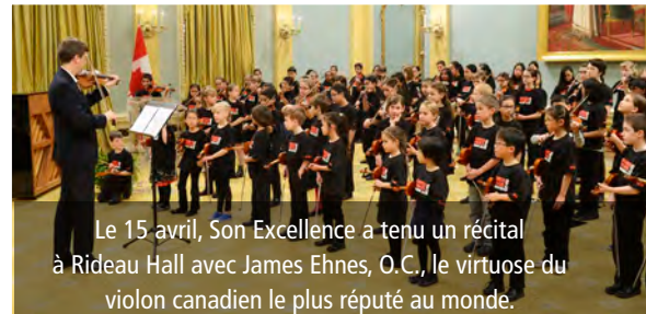
Le 15 avril, Son Excellence a tenu un récital à Rideau Hall avec James Ehnes, O.C., le virtuose du violon canadien le plus réputé au monde.

Son Excellence M me Sharon Johnston le 3 mars 2017