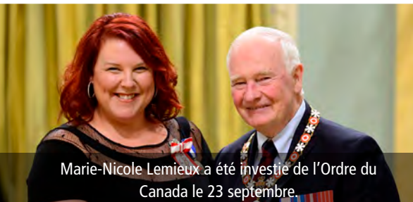
Marie-Nicole Lemieux a été investie de l'Ordre du Canada le 23 septembre.