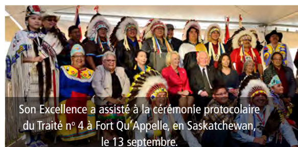
Son Excellence a assisté à la cérémonie protocolaire du Traité n° 4 à Fort Qu'Appelle, en Saskatchewan, le 13 septembre.