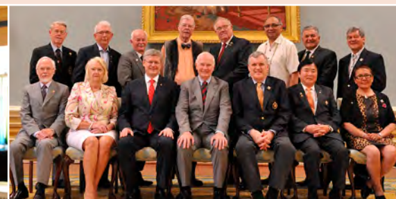
Les participants à la conférence annuelle des lieutenants-gouverneurs et des commissaires ont eu la chance de rencontrer le premier ministre à Rideau Hall.