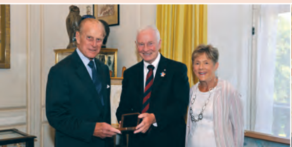
Son Excellence a remis la Médaille du jubilé de diamant à Son Altesse Royale le duc d'Édimbourg, un membre du Conseil privé de la Reine pour le Canada.