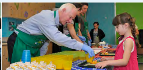
Son Excellence a aidé des bénévoles à servir le déjeuner à des élèves de l'école primaire Notre-Dame.