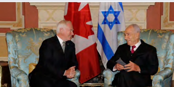
Le 7 mai, Son Excellence Shimon Peres, président de l'État d'Israël, a entamé sa visite d'État au Canada.