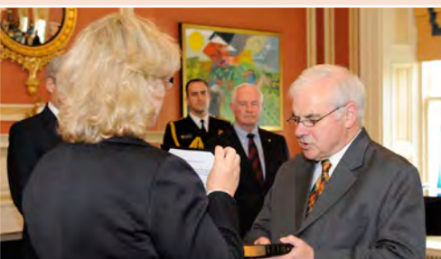
L'honorable Peter Milliken a été assermenté en tant que membre du Conseil privé de la Reine pour le Canada.