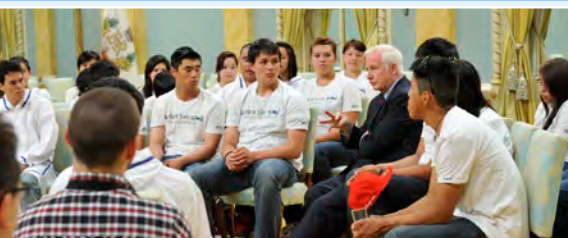
Son Excellence a animé une discussion avec des participants au programme Northern Youth Abroad de 2012.

Le gouverneur général participe à des cérémonies commémoratives, des célébrations nationales, des visites dans les provinces et les territoires et des activités communautaires partout au pays. Il est également l'hôte d'événements dans ses deux résidences officielles : Rideau Hall et la Citadelle de Québec.