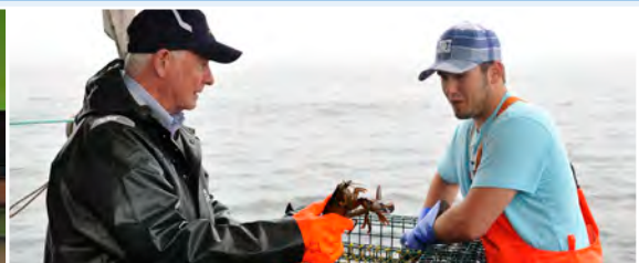
À Yarmouth, Son Excellence a participé à la pêche au homard, une activité essentielle à l'économie régionale.