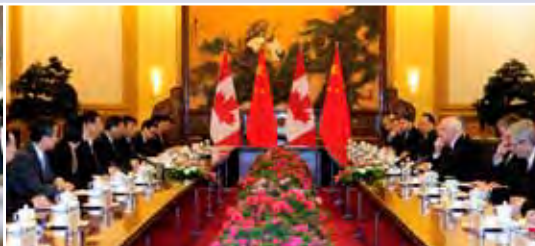
En octobre, le gouverneur général a rencontré Son Excellence M. Xi Jinping, président de la République populaire de Chine, avec qui il a discuté d'intérêts communs aux deux pays.