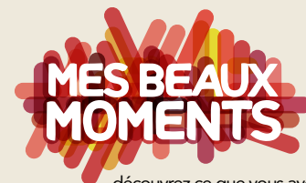
En novembre, Son Excellence a lancé la campagne Mes beaux moments.