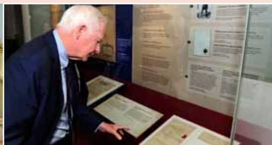
Le gouverneur général a eu l'occasion d'examiner la Proclamation royale de 1763, qui était exposée au Musée canadien des civilisations en octobre.