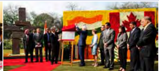
En février, Leurs Excellences ont dévoilé et présenté un inuksuk au peuple de l'Inde au nom du peuple du Canada; ce cadeau symbolise l'amitié et la coopération entre les deux pays.

En 2013-2014, le Bureau a appuyé le gouverneur général David Johnston dans le cadre des visites qu'il a effectuées dans huit pays pour représenter le Canada à l'étranger.