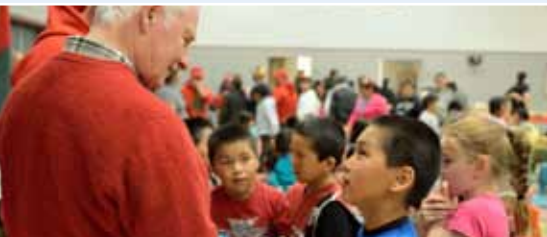
En juin, Son Excellence a participé à un rassemblement communautaire à la Amos Comenius Memorial School à Hopedale (Terre-Neuve-et-Labrador)

Le gouverneur général participe à des cérémonies commémoratives, des célébrations nationales, des visites dans les provinces et les territoires et des activités communautaires partout au pays. Il est également l'hôte d'événements dans ses deux résidences officielles : Rideau Hall à Ottawa et la Citadelle de Québec.