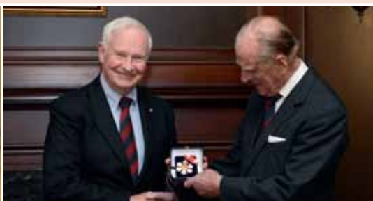
Pendant une visite à Toronto en avril, Son Excellence a remis l'insigne de Compagnon de l'Ordre du Canada à Son Altesse Royale le prince Philip, duc d'Édimbourg.