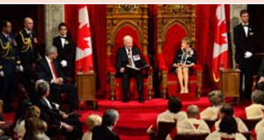
Le gouverneur général a lu le discours du Trône au Sénat le 16 octobre 2013.