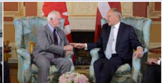
En septembre, dans le cadre d'une visite de travail au Canada, Son Excellence M. Andris Berzinš, président de la République de Lettonie, a rencontré le gouverneur général.