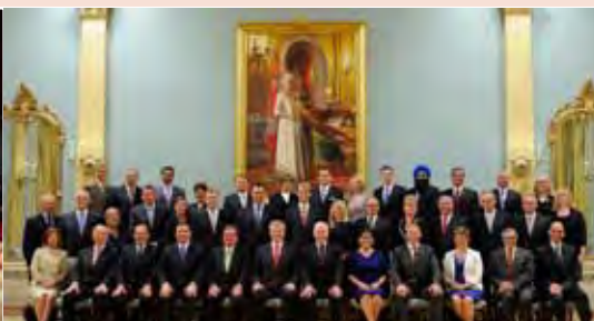
Son Excellence a présidé l'assermentation du nouveau conseil des ministres le 15 juillet 2013.