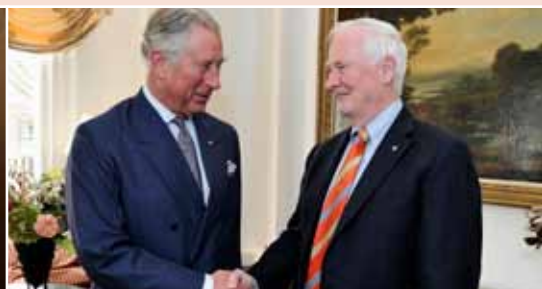
En avril, pendant qu'il se trouvait à Amsterdam pour assister à la cérémonie d'investiture de Sa Majesté le roi Willem-Alexander, Son Excellence a rencontré Son Altesse Royale le prince de Galles.

En 2013-2014, le Bureau a appuyé près de 100 activités de représentation de la Couronne au Canada.