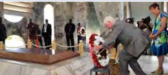
En mai, Leurs Excellences ont rendu hommage à feu M. Kwame Nkrumah, ancien président du Ghana, en déposant une couronne de fleurs sur son mausolée.

Le gouverneur général représente le Canada au pays et à l'étranger, accueille les chefs d'État en visite au Canada, effectue des visites d'État à l'étranger, reçoit les lettres de créance des chefs de missions étrangères et signe des documents diplomatiques.