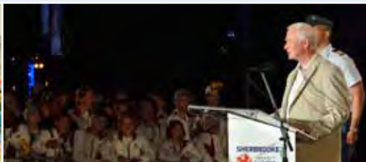
En août, le gouverneur général a annoncé la clôture officielle des Jeux d'été du Canada 2013 à Sherbrooke (Québec).