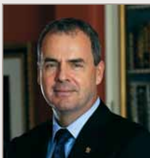
Stephen Wallace Secrétaire du gouverneur général

Le Bureau collabore étroitement avec la Commission de la capitale nationale (CCN), la Gendarmerie royale du Canada (GRC), la Défense nationale (MDN), Travaux publics et Services gouvernementaux Canada (TPSGC), le ministère des Affaires étrangères, Commerce et Développement Canada (MAECD) et Patrimoine canadien (PCH).