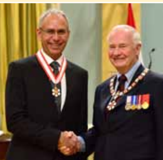
Arnold Boldt, O.C., compte parmi les 38 personnes qui ont reçu l'Ordre du Canada le 22 novembre 2013.

Le gouverneur général décerne des distinctions honorifiques et des prix à des gens qui ont fait preuve d'excellence ou d'une volonté de servir le pays. L'excellence et les réalisations sont soulignées par l'entremise du Régime canadien de distinctions honorifiques et par la concession d'emblèmes héraldiques (armoiries, drapeaux et insignes).