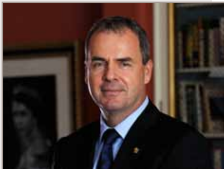
Stephen Wallace Secrétaire du gouverneur général

Le Bureau collabore étroitement avec la Commission de la capitale nationale (CCN), la Gendarmerie royale du Canada (GRC), le ministère de la Défense nationale (MDN), le ministère des Affaires étrangères et du Commerce international (MAECI) et le ministère du Patrimoine canadien (PCH).