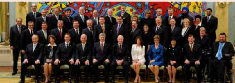
Le gouverneur général a présidé à l'assermentation des ministres du Cabinet le 18 mai 2011 à Rideau Hall.

L'une des responsabilités du gouverneur général est de veiller à ce que le Canada ait toujours un premier ministre. Le gouverneur général préside à l'assermentation du premier ministre, du juge en chef du Canada et des ministres du Cabinet; convoque, proroge et dissout le Parlement; prononce le discours du Trône; et accorde la sanction royale aux mesures législatives parlementaires. Le gouverneur général agit sur l'avis du premier ministre, mais a le droit de conseiller, d'encourager et de mettre en garde.