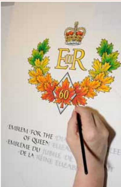
L'Autorité héraldique du Canada a conçu l'emblème et la médaille commémorative du jubilé de diamant.